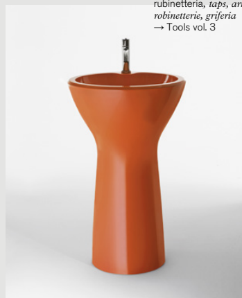
○ Fez rubinetteria, taps, armatur, robinetterie, grifería → Tools vol. 3