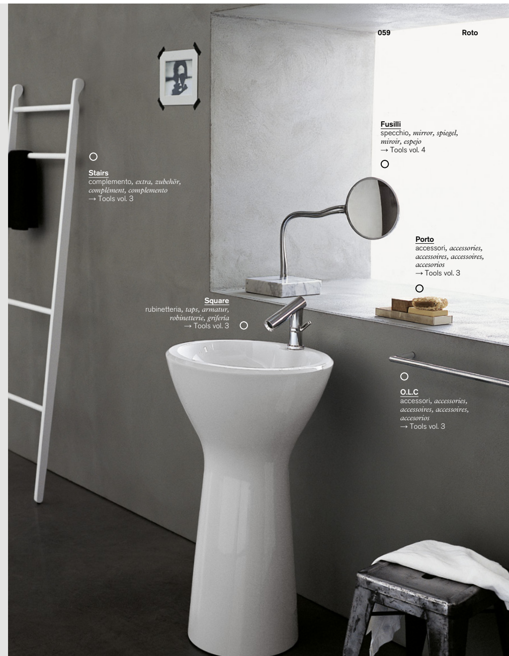
○ Stairs complemento, extra, zubehör, complément, complemento → Tools vol. 3