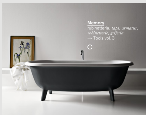
Memory rubinetteria, taps, armatur, robinetterie, grifería → Tools vol. 3

Una bañera con líneas inspiradas en un pasado remoto, interpretada en función de una estética esencial y actual; a diferencia de las antiguas bañeras de fundición, Ottocento está realizada en Cristalplant® biobased, un moderno material compuesto, suave y sedoso al tacto que mantiene la temperatura cálida del agua. Disponible en blanco o bicolore con exterior gris claro o gris oscuro.