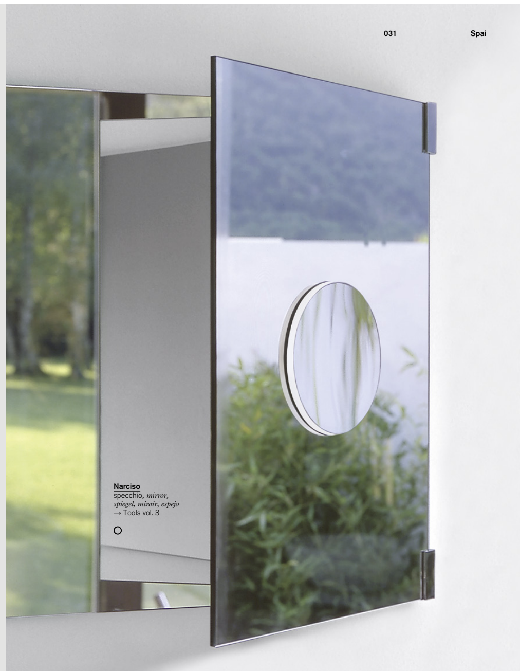
Narciso specchio, mirror, spiegel, miroir, espejo → Tools vol. 3