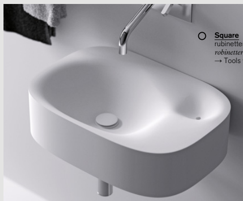
○ Square rubinetteria, taps, armatur robinetterie, griferia → Tools vol. 3

El lavabo Nivis está formado por dos concavidades unidas. El agua pasa de la principal, más amplia y profunda, a la más pequeña, por el rebosadero. Un artificio escultural que crea un efecto dinámico y armonioso en la masa blanca del Cristalplant® biobased.