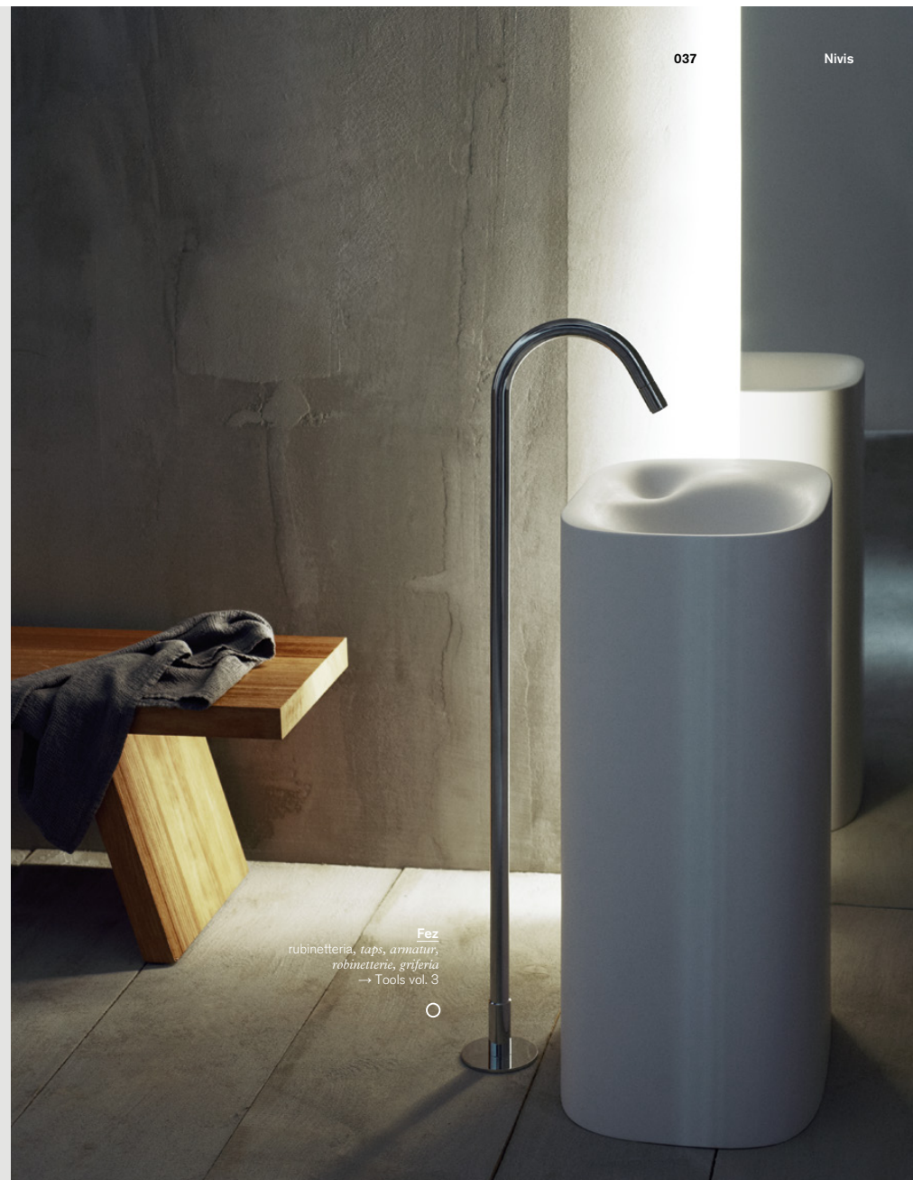
○ Fez rubinetteria, taps, armatur, robinetterie, griferia → Tools vol. 3